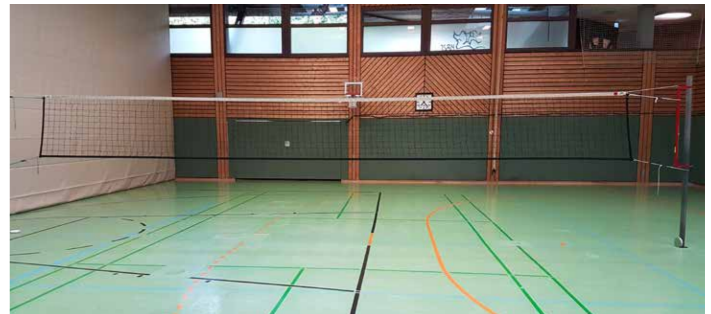
Der Ort des Geschehens

P.S. Der Spielstand nach 14 Aufeinandertreffen ist 8 zu 6 für Dienstägler