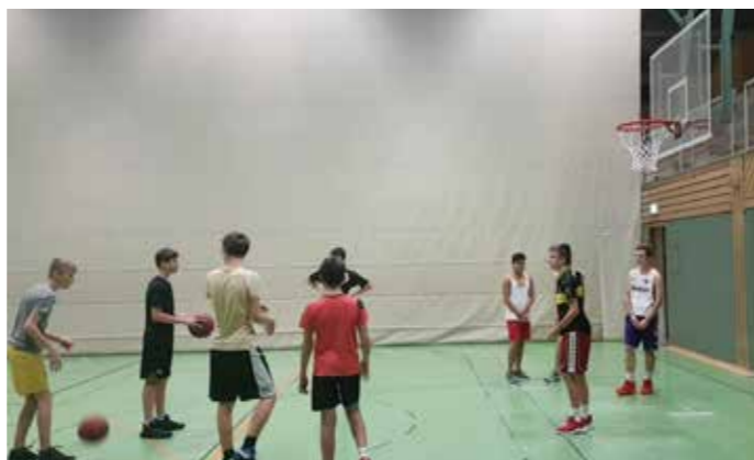
Trainingseindruck: Würfe sind wichtig!

Unser stärkstes und personell am besten aufgestelltes Team, die U16, startet auch mit sehr durchwachsener Trainingsbeteiligung. Viele Spieler kommen sporadisch ins Training, oder haben sogar aufgehört. Training ist somit nur eingeschränkt möglich. Die ersten Spiele haben das auch klar aufgezeigt, in der Landesliga herrschen eben doch andere Gesetze und vor allem warten dort härtere Gegner und bessere Spieler. Alle drei Spiele gingen klar verloren, aber das Auftaktprogramm war auch gegen die Besten. Die Coaches Pano und Gerhard erwarten sich durch konsequente Fehleraufbereitung und hartes Training Besserung in den nächsten Spielen.