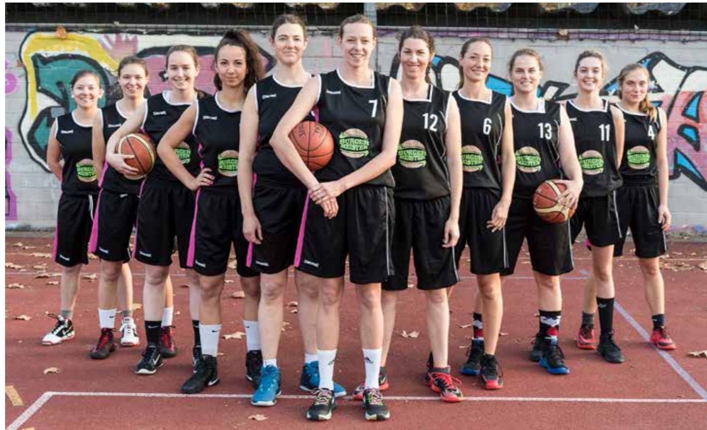
Die neuen Trikots mit unserem neuen Sponsor Burgermeister. Auf dem Bild fehlen die Spielerinnen Eisnecker, Behrens und Coach Yimga

// Text: Anna Ross // Fotos: Sascha Walther, sport-px.de